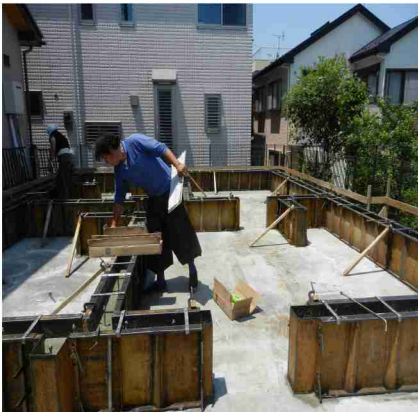
コンクリート打ち込み作業