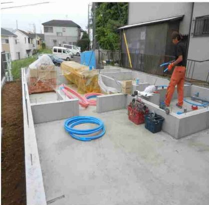
基礎完了後に水道配管施工