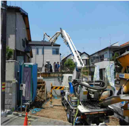
基礎コンクリート打設工事